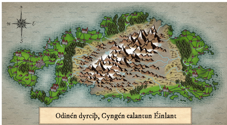
Figure 1: Carte du XIX ème siècle d'Éinlante

Le Mattér est parlé par un peuple imaginaire vivant sur une île également imaginaire nommée Éinlante ( terre solitaire , Einlant en Mattér), peuplée vers la fin du IX ème siècle par un peuple parlant le Vieux Nordique, partis probablement de la péninsule scandinave ou des jeunes colonies Islandaise par bateau. À l'instar de l'Islande, le peuple Matté s'y étant installé est devenu isolé, permettant une évolution unique de leur langue.