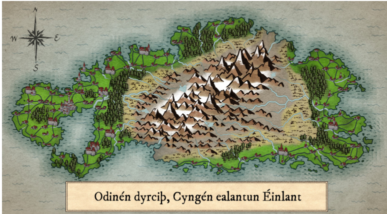
Figure 1: Carte du XIX ème siècle d'Éinlante

Le Mattér est parlé par un peuple imaginaire vivant sur une île également imaginaire nommée Éinlante ( terre solitaire , Einlant en Mattér), peuplée vers la fin du IX ème siècle par un peuple parlant le Vieux Nordique, partis probablement de la péninsule scandinave ou des jeunes colonies Islandaise par bateau. À l'instar de l'Islande, le peuple Matté s'y étant installé est devenu isolé, permettant une évolution unique de leur langue.