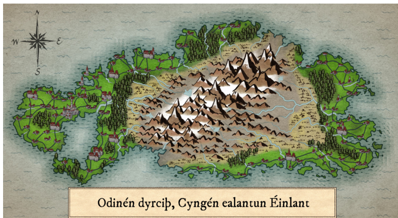
Figure 1: Carte du XIX ème siècle d'Éinlante

Le Mattér est parlé par un peuple imaginaire vivant sur une île également imaginaire nommée Éinlante ( terre solitaire , Einlant en Mattér), peuplée vers la fin du IX ème siècle par un peuple parlant le Vieux Nordique, partis probablement de la péninsule scandinave ou des jeunes colonies