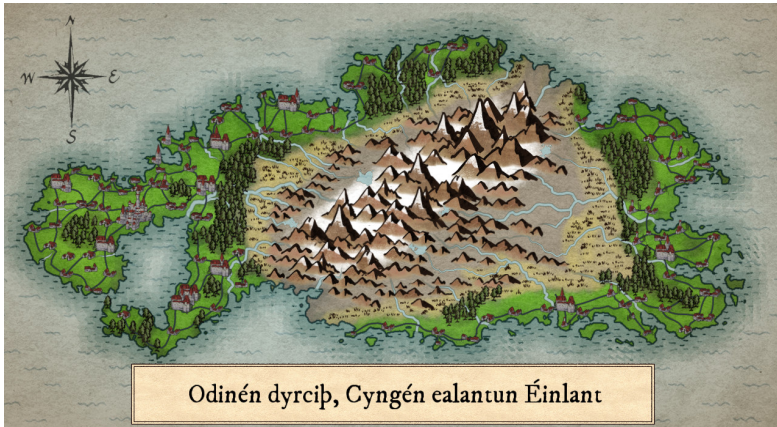
Figure 1: Carte du XIX ème siècle d'Éinlante

Le Mattér est parlé par un peuple imaginaire vivant sur une île également imaginaire nommée Éinlante ( terre solitaire , Einlant en Mattér), peuplée vers la fin du IX ème siècle par un peuple parlant le Vieux Nordique, partis probablement de la péninsule scandinave ou des jeunes colonies Islandaise par bateau. À l'instar de l'Islande, le peuple Matté s'y étant installé est devenu isolé, permettant une évolution unique de leur langue.