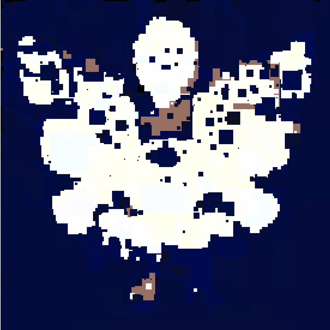
Figure 2: Image générée à partir de img/mahakala-monochrome.png avec 2000 améliorations avec la seconde méthode